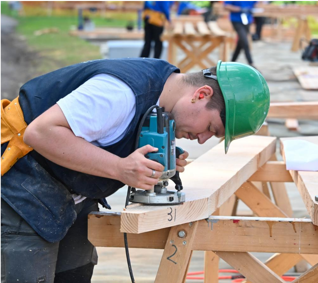
Deuxième jour de challenge au parc du Cours d'Épinal ce dimanche pour les Défis du bois et leur édition anniversaire basée, cette année des 20 ans, sur le thème du jumelage.